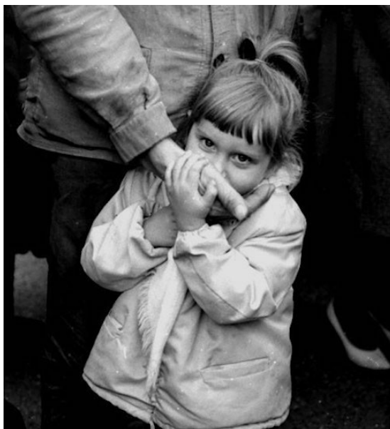
Photographie 4. Grève de mineurs de fer de Trieux – 1963 Tous les jours au meeting qui avait lieu sur la Place du village, il y avait cette petite fille à l'abri dans la main de son père.