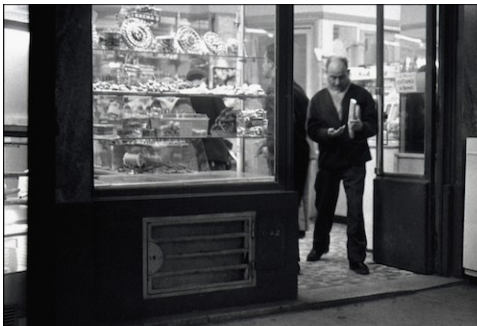
Photographie 7. Le poids de la monnaie – 1965.

La discussion porte à présent sur une photo dont le titre est Le poids de la monnaie .