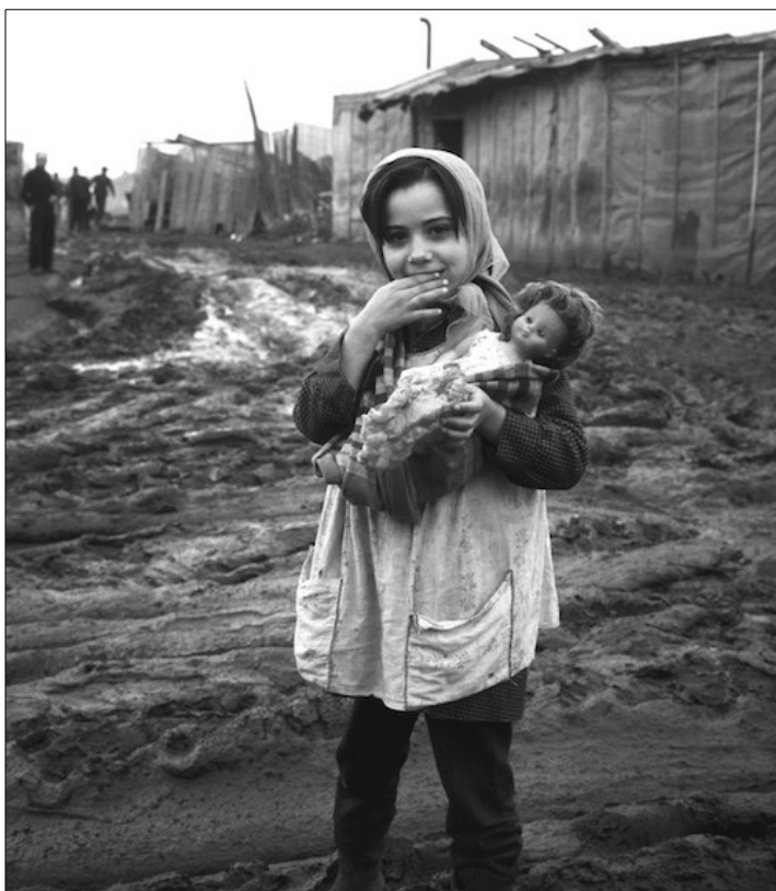
Photographie 8. La petite portugaise du bidonville – 1969.

C'est important, les pièces c'est important, les gars ils vivaient encore au jour le jour, ils avaient de petites payes, hein ! C'est gigantesque. Quand j'ai fait ça j'étais content, j'étais heureux, j'ai dégusté ma photo... C'est le type de chance, de la chance voulue, parce que j'étais dans ma voiture, je regardais un peu ce qui se passait et puis il y avait cette boulangerie et d'un seul coup j'ai vu le type rentrer, je me suis dit : tiens ça c'est sûrement un ouvrier, il va acheter son pain et paf, j'ai fait la photo en pensant au poids de la monnaie. Et puis après je suis descendu de voiture, j'ai parlé avec lui. C'était un portugais, pour l'authentification de ma photo. Ça aurait pu être un français, mais c'était un portugais. Je vérifie quand même ! Le coiffeur dans le bidonville par exemple, c'est le bidonville portugais, là il y a pas besoin de demander.