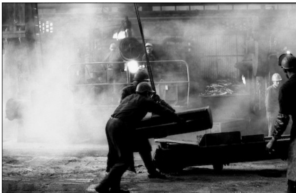
Photographie 5. En Moselle à l'usine Gerlasch à Bouzonville – Sidérurgie – 24/5/1973.

La discussion s'oriente vers la photographie à l'usine : l'usine, comment y entrer ? Comment entrer dans « le laboratoire secret de la production » comme disait Marx ?