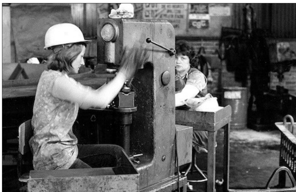
Photographie 6. Usines Gerlach à Bouzainville – 25/5/1973.