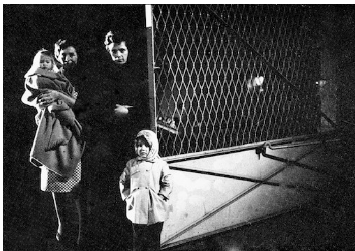
Photographie 3. Grève des mineurs de Trieux – Mineurs de fer (Lorraine) – 1963. Les hommes occupent la mine. Les femmes viennent dans la nuit, aux nouvelles. Il fait froid. C'est l'hiver.