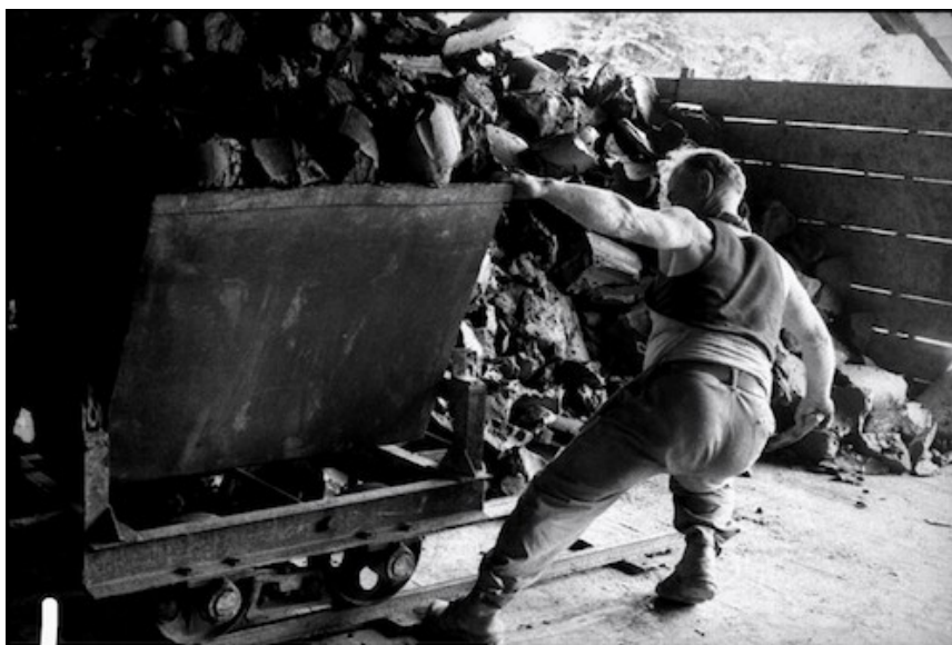
Photographie 1. Mineur de glaise à provins – 1961.

La discussion porte ensuite sur deux photos publiées dans Les prolos , qui représentent des mineurs au travail dans une mine de glaise à Provins, en 1961.